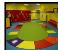
PlastoSport PU Синтетический пол