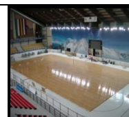
Универсальный воздушный пол над льдом