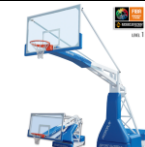
Баскетбольный мишеный вал