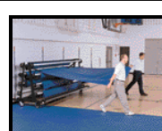
Защитное покрытие пола